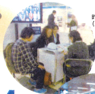
昨年の会場のように (JR札幌駅 西口コンコース)

くらしの中に土木がある 人間らしい環境を整えていく仕事～ 「土木」についてご紹介します。